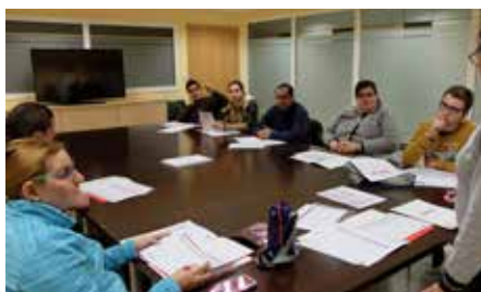
En marxa el Club de la Feina 20 de novembre.