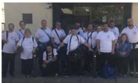
Èxits del Club Esportiu als Jocs Special Olympics 2018 8 d'octubre.