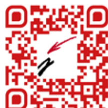
El Jornade de treballadors Avancem en qualitat