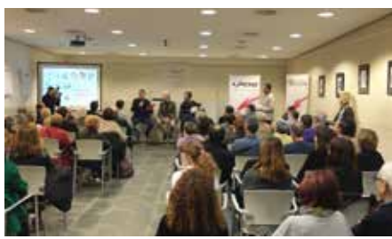
Presentem el calendari "Un any d'esport solidari" 3 de desembre.