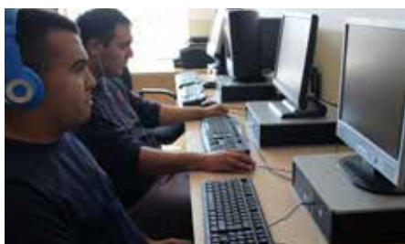
Donació d'equips informàtics del Programa UPC Reutilitza 25 d'octubre.