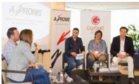
Reunim empreses i institucions amb compromís per la inserció laboral 4 d'octubre.