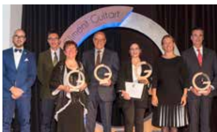
Rebem el Premi Solidaritat als IV Premis Climent Guitart 9 de novembre.