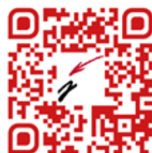
Festa del 50è aniversari 20 de juliol, Blanes