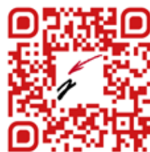
Jornada per a empreses i institucions amb compromís per la inserció laboral