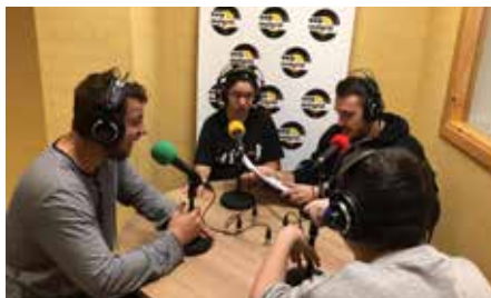
Ens fem sentir al programa "La Jungla" d'Ona Malgrat 15 novembre.