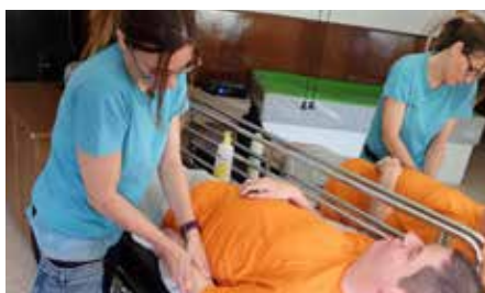
Prou congelacions i retallades, és hora de donar solucions 3 de desembre.